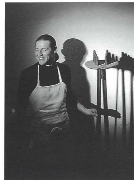
Der Künstler in seinem Atelier

Der Kulturkalender 1997 ist kostenlos beim Bundespressesdienst/Bundeskanzleramt erhältlich.