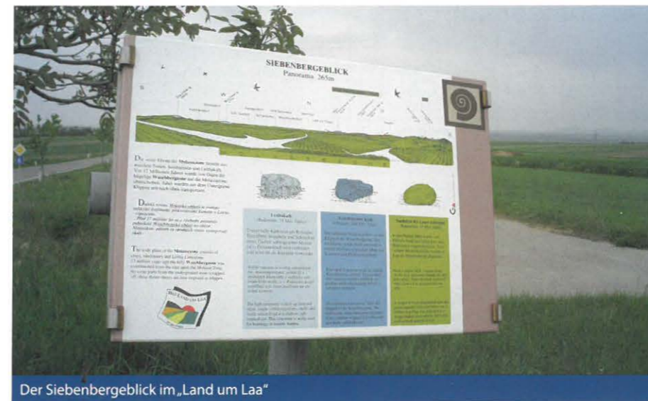
Der Siebenbergblick im „Land um Laa“

Weitere Geologietafeln wurden an Punkten mit hoher Besucherfrequenz aufgestellt, wie zum Beispiel der Staatzer Klippe mit dem Thema „Entstehung der Kalkklippe“, bei der Ruine Falkenstein die „Herkunft der Gesteine“, der Zufahrt zur Kellergasse des Galgenberges mit dem Erdgasfeld Wildendümbach und am so genannten „Siebenbergblick“ an der B6 bei Unterstinkenbrunn