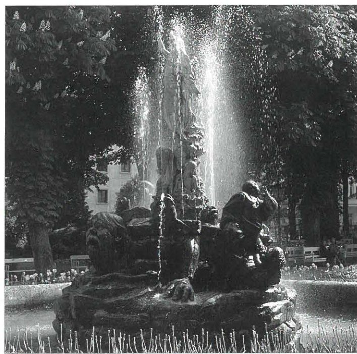
Im Kurpark Baden/Wien